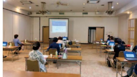
護国会館にて参加