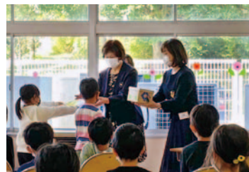
宇都宮市立田原西小学校