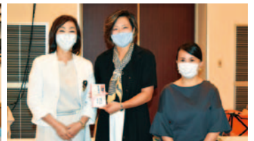
育成資金贈呈 宇都宮ベンチャークラブ