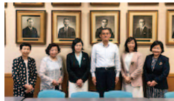
育成資金贈呈 県立宇都宮中央女子高等学校