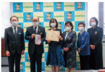
県教育委員会贈呈